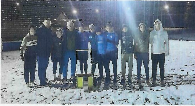
Donacija stroja za označavanje terena NK Gospiću '91