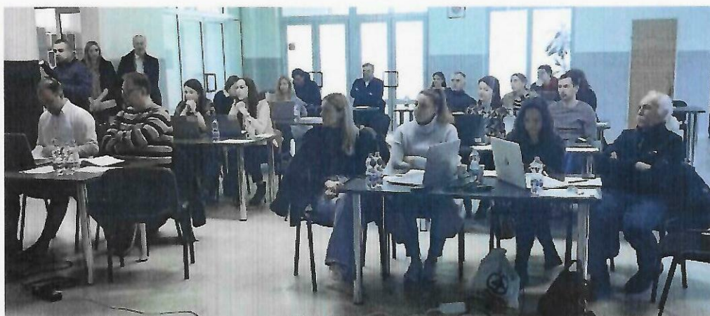
Održana radionica za potencijalne prijavitelje na natječaj za program Erasmus+: Sport u organizaciji Zajednice sportova Ličko-senjske županije, veljača 2024.

Redovne pretplate na stručnu literaturu i edukacije djelatnika u sportu na tematskim sjednicama, odnosno tečajevima za djelatnike u sportu Hrvatskog olimpijskog odbora, Ministarstva turizma i sporta i ostalih organizatora.