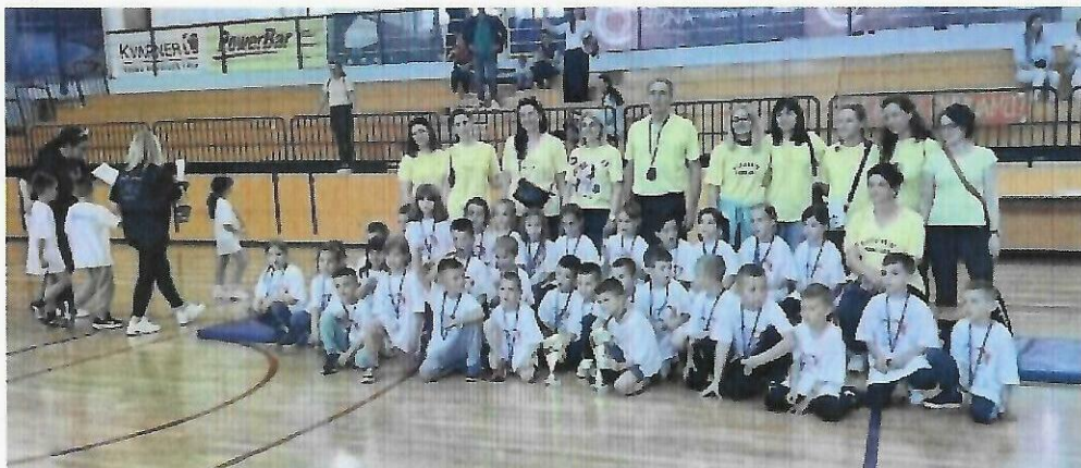
Olimpijski festival dječjih vrtića, Novalja, svibanj 2024., pobjednici – DV Pahuljica

U partnerstvu s Hrvatskim olimpijskim odborom, jedinicama lokalne uprave, NP Plitvička Jezera i sportskim klubovima proveden je Olimpijski festival dječjih vrtića. Domaćin 2024.g. bio je DV Carić iz Novalje. Pobjednik Olimpijade bio je DV pahuljica iz Gospića. Sudjelovalo je 6 vrtića s područja Ličko-senjske županije s oko 240 djece predškolskog uzrasta. Natjecali su se u 6 disciplina: atletika, mali nogomet, trčanje 50 m, štafeta 4x25 m, skok u dalj s mjesta i bacanje loptice.